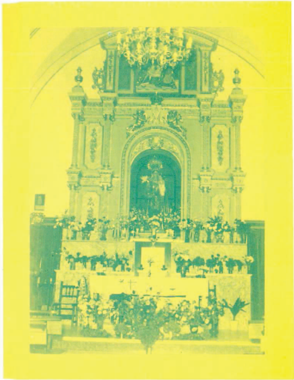
HERMANDAD DE NTRA.SRA. DE LA ANTIGUA DE MANJAVACAS ————— FIESTAS 1.987 —————