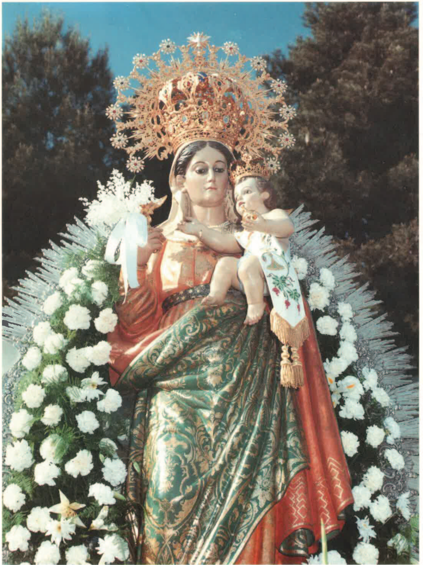
Nuestra Señora de la Antigua de Manjavacas Patrona de Mota del Cuervo