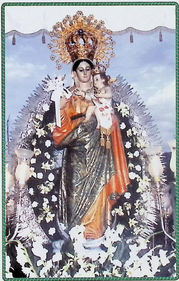
MOTA DEL CUERVO (Cuenca)