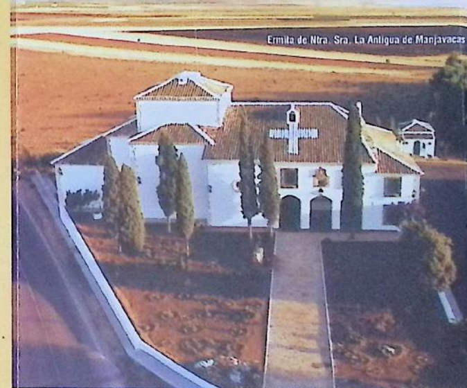
Ermita de Ntra. Sra. La Antigua de Manjavacas